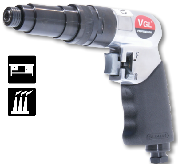
VGL SA-622 1 z regulacją wewnętrzną